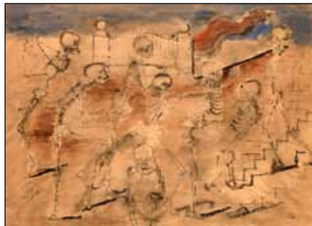
Paul DELVAUX, Squelette à l'escalier, 1934, Collection privée