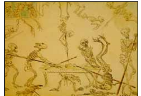
James ENSOR, Squelettes jouant au billard , 1903, Mu.ZEE, Oostende, © Sabam, Belgium 2010, photo Mu.ZEE Oostende.