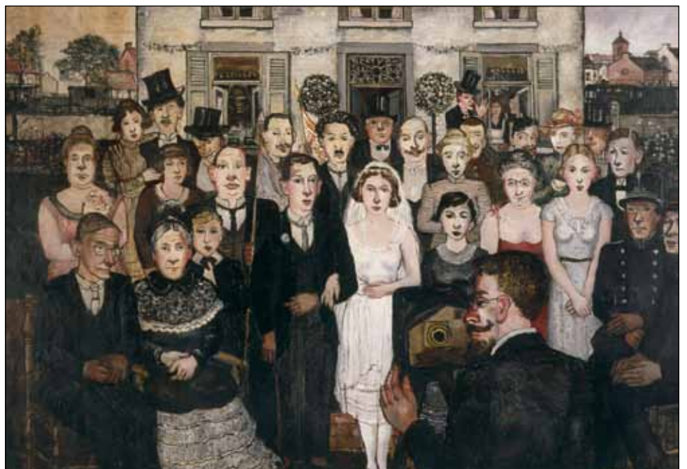
Les noces à Antbel, 1932, huile sur toile. Collection privée.