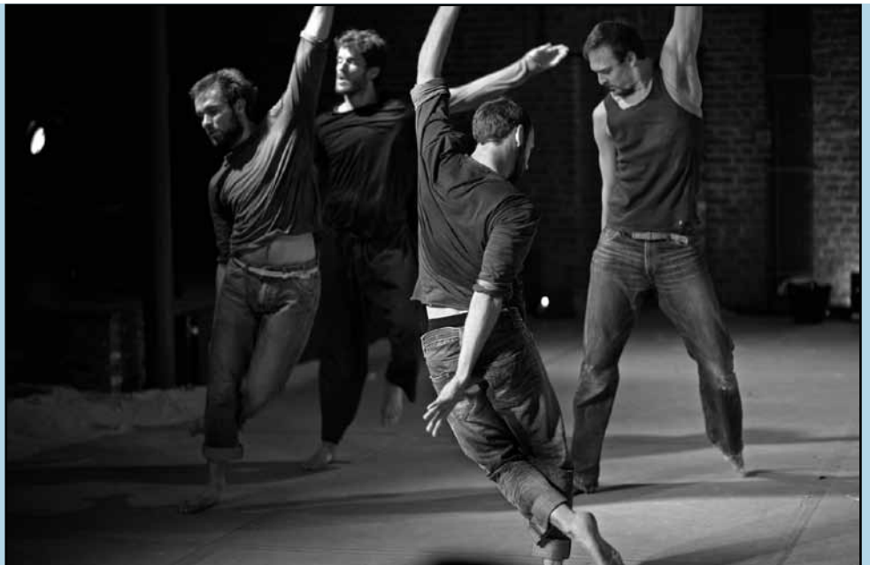
Danse Balsa Marni