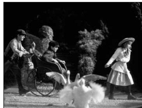
The Secret Garden