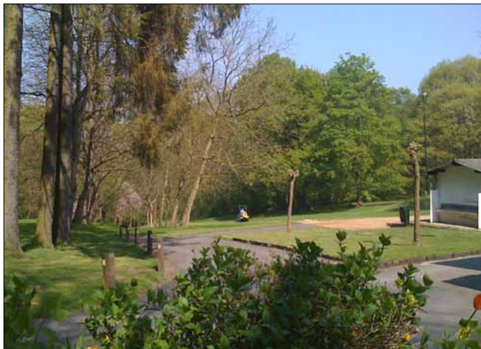
Domaine de Basse-Wavre