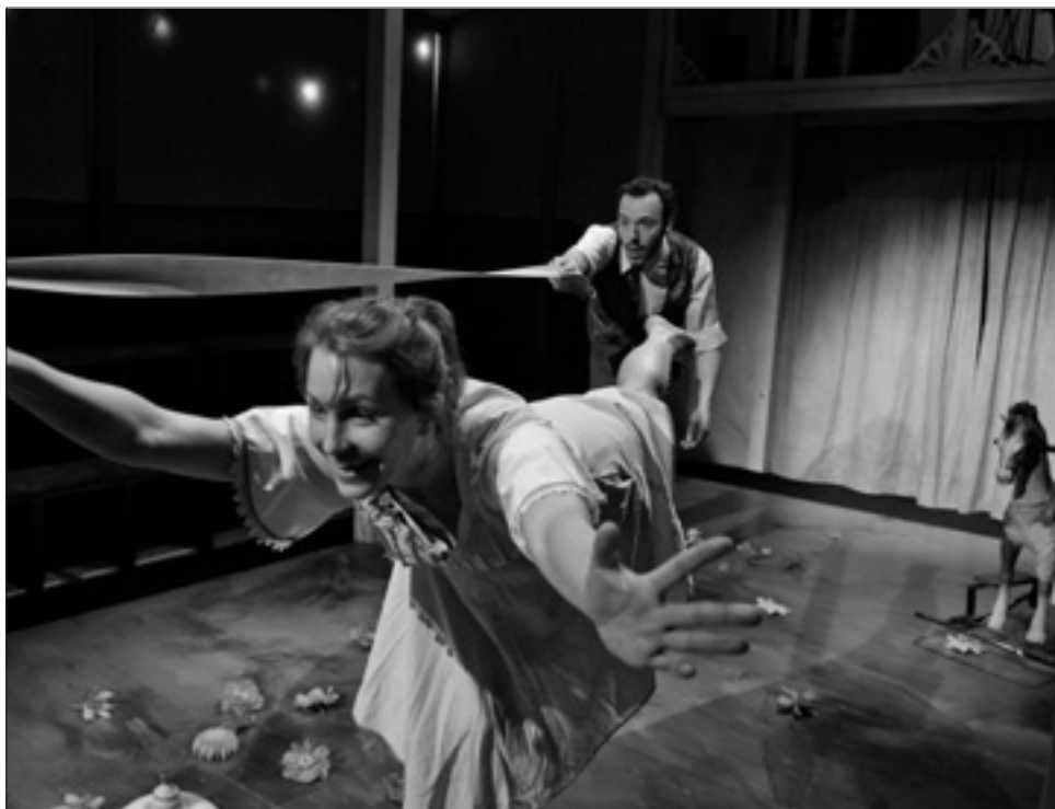
Le cheval de bleu

L'L, rue Major René Dubreucq 7 - 02 512 49 69