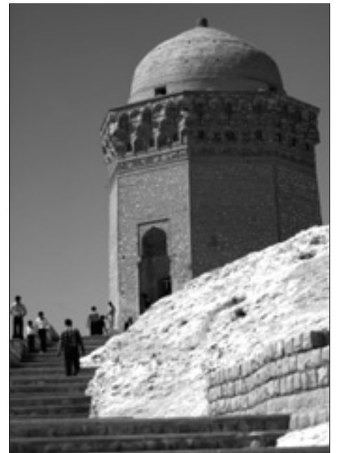
Tour historique - Iran

Club Denise-Yvon , Scepterstraat 39 - dinsdag, vrijdag.