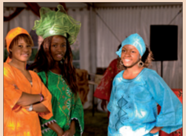
Souvenir de l'African Week (10/09/2008). Plus de photos sur www.ixelles.be / Souvenir van de Afrikaanse Week (10/09/2008). Meer foto's op www.elsene.be !

In het kader van de Europese jaar voor interculturele dialoog, organiseert het Europees Parlement een "Arab Week" die zal in samenwerking met het Schepenambt Europa een concertavond op Flageyplein op woensdag 5 november voorstellen. Op de affiche: de legendarische marokkaanse groep Nass El Ghiwane , en ook "The art of sawt" van Bahrein en "Saudi popular arts group". De avond vangt aan om 19.30 om omstreeks 23.00 te eindigen.