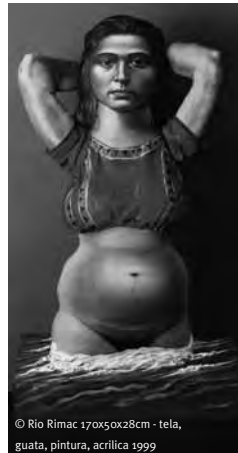
© Rio Rimac 170x50x28cm - tela, guata, pintura, acrílica 1999