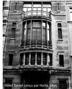
Hôtel Tassel conçu par Horta, 1895

♣ Denise-Yvon Club Ⓢ Dinsdag 15 et 22/02, namiddag