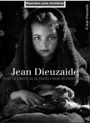
Reporters sans frontières