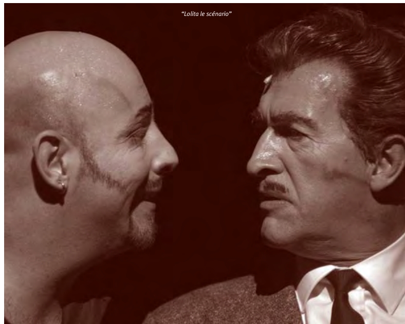
"Lolita le scénario"

1er, 2, 8, 9, 15, 16, 22, 23 et 29/2 à 20h