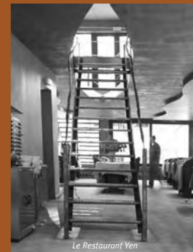
Le Restaurant Yen