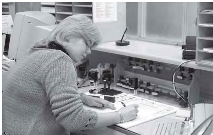
La délivrance de documents administratifs par l'Administration sera désormais entièrement gratuite pour les personnes qui émargent au CPAS

Considérée sous cet angle, la fiscalité cesse alors d'être un facteur négatif pour devenir un ensemble de dispositions légales qui permettront le financement des opérations menées par la majorité en place. La fiscalité doit être une matière vivante, qui évolue en même temps que la société. Elle doit ainsi être modifiée selon les orientations que les citoyens, relayés par le politique, veulent donner à la vie de la communauté.