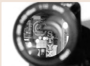
AMATEURS 1. Nicolas HOUVOUX