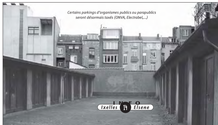
Certains parkings d'organismes publics ou parapublics seront désormais taxés (ONVA, Electrabel,...)

Infos: Service des Taxes, 02 515 62 48 et www.ixelles.be