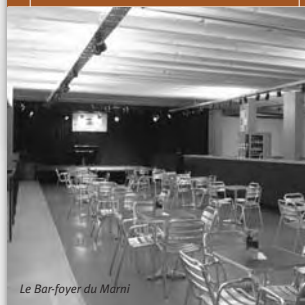
Le Bar-foyer du Marni

Info: Dienst Belastingen, 02 515 62 48 en www.elsene.be