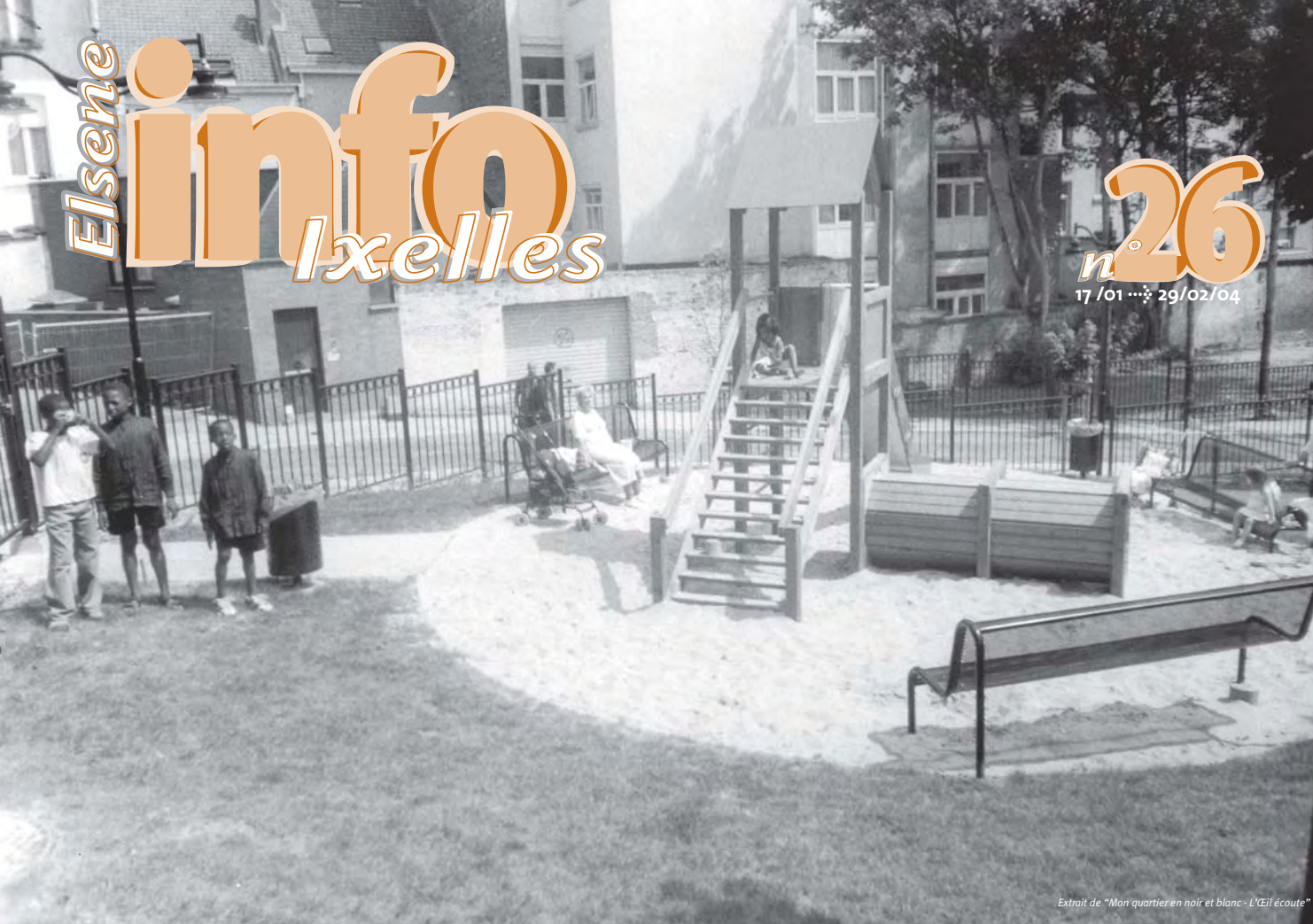
Extrait de "Mon quartier noir et blanc - L'œil écoute"