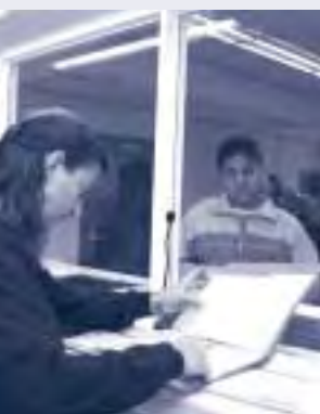
Bureau de pointage