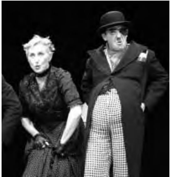
L'OPÉRA DES GUEUX

Un spectacle nyctalope pour contrer une fois pour toutes la peur du noir et se réconcilier avec la poche d'obscurité qui nous a engendrés! Unanimement salué par la presse à sa création en petite salle la saison passée, ce magnifique solo qui projette des ombres comme autant de surgissements mystérieux de nous-mêmes, est ici repris en grande salle. Chorégraphie Nicole Mossoux et Patrick Bonté. Prix: de 9 à 17 euros. ☛ Théâtre Varia, rue du Sceptre 78 ☎ Infos: 02 640 82 58 Réservation: 02 640 35 50 ☉ Ven. 28 et sa. 29/11 à 20h30