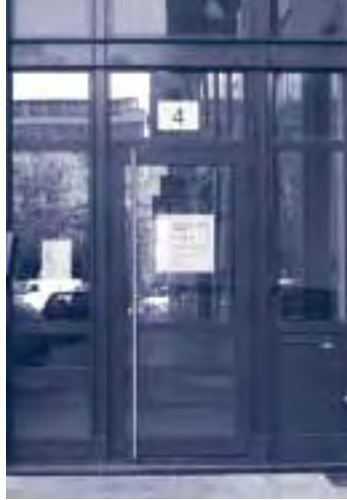
Place du Champ de Mars