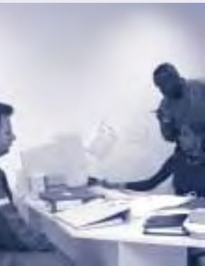
Bureau Information - Emploi 1 er étage