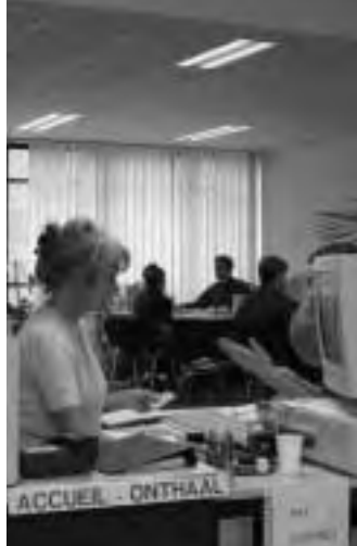
Afdeling Informatie - Tewerkstelling

Deze dienst is gespecialiseerd in de sociaal-economische reclassering van de minder gekwalificeerden. Ontvangdagen: maandag tussen 9u en 12u, woensdag tussen 13u30 en 16u, vrijdag tussen 9u en 12u. De persoon kan er een raadgever ontmoeten, die met haar de