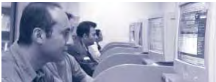
ALE 3 de verdieping