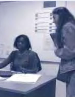
Agence locale pour l'Emploi - 3 ème étage