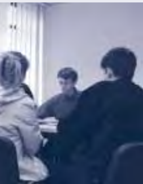
Bureau Information-Emploi - 1 er étage