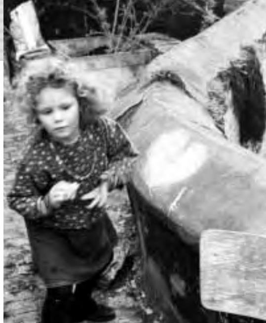
"L'œil à l'écoute" - B. Meiers