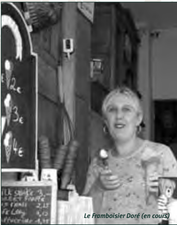
Le Framboisier Doré (en cours)

Infos: 02 515 67 36 ou sur le site www.jdebruxelles.be