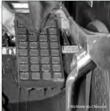
L'Alchimie du Chocolat