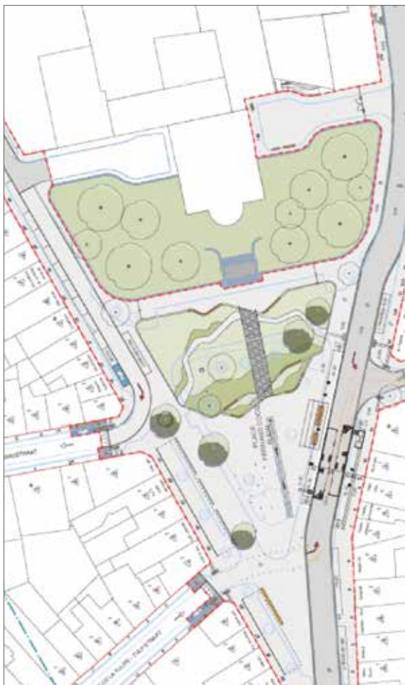
Plan 1 : 17 januari 2017.

De wil van de politiek is dus het plein nieuw leven in te blazen en het sfeervolle karakter van vroeger terug te geven. De nabijheid van het Museum en de Franstalige en Nederlandstalige bibliotheken scheidt ruimte voor tal van initiatieven. De schepenen voor Solidariteit en Jeugd zijn ook van plan projecten voor te stellen voor de aanzienlijke openbare ruimte die voor de trappen van het gemeentehuis ligt. Ten slotte zal de nieuwe openbare ruimte een harmonieuze economische en commerciële ontwikkeling mogelijk maken. Ook in die zin werden verbeteringen aangebracht aan het project. In het licht van de toegankelijkheid, de groenvoorzieningen en de plaatsing van de toekomstige terrasruimtes, wordt het nieuwe plein beschouwd als een ruimte voor uitwisselingen en ontmoetingen.