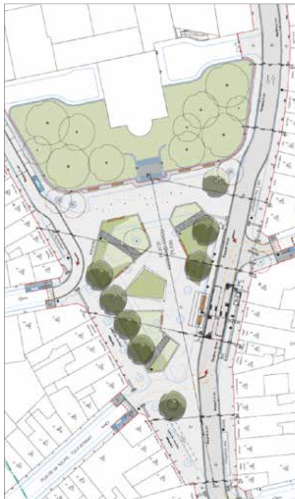
Plan 2 : 4 april 2017.