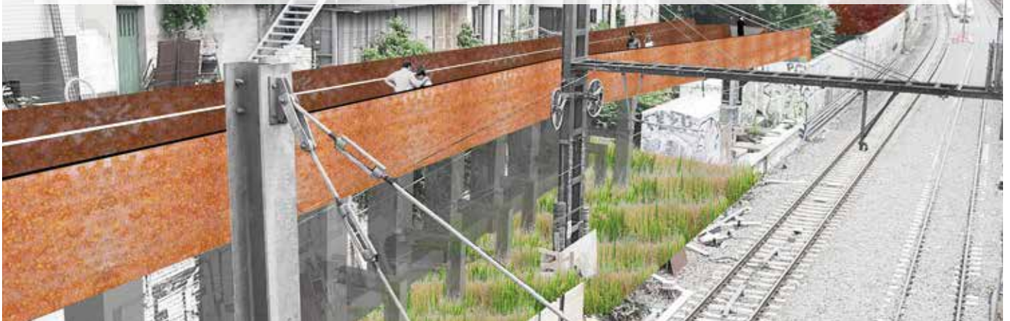
Verbinding Graystraat-Scepterstraat / Liaison Gray - Sceptre