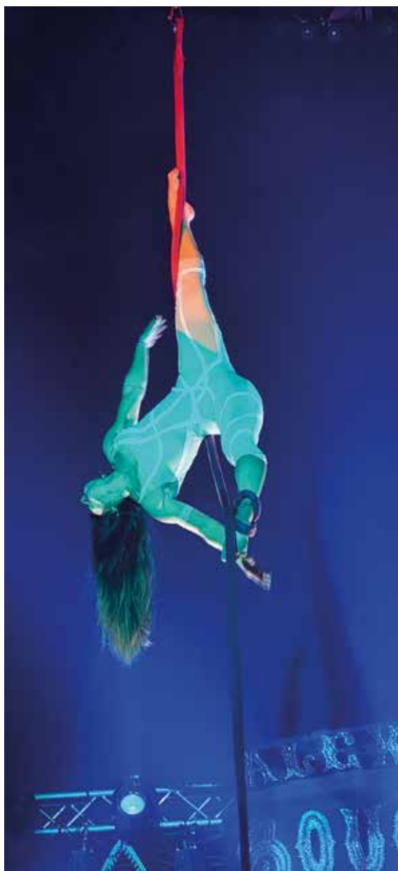
Sabine de Moerloose

Pour les découvrir en trois dimensions, rendez-vous l'hiver prochain sous le chapiteau de la place Flagey !