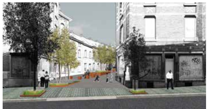
Ambachtsliedenstraat / Rue des Artisans

Met de nieuwe verbinding tussen de Europese wijk en de wijk Gray/Mouterij zullen de inwoners beschikken over een kortere en aangenamere weg die bovendien autovrij is. Daarbij worden vele voorzieningen en openbare ruimtes ook beter met elkaar verbonden. Een toonaangevend project voor Elsene!