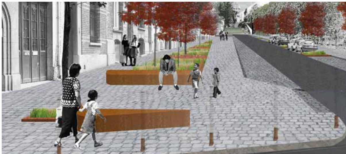
Rue des Deux Ponts / Tweebruggenstraat

Cette nouvelle liaison entre le quartier européen et le quartier Gray/Gerموir offrira aux habitants un itinéraire plus court et plus agréable, préservé de la présence automobile tout en facilitant le maillage de nombreuses infrastructures et espaces publics du quartier. Un projet d'envergure pour Ixelles !