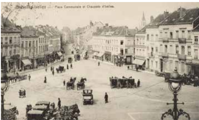
Place F. Cocq fin 19 ème

Premier aménagement d'espace public conçu par les autorités communales, la place Fernand Cocq est la première place publique créée à Ixelles (milieu du 19 ème siècle). D'emblée, elle devient le centre symbolique de la commune, un lieu de sociabilité et de festivités. Elle doit répondre à de nombreuses attentes et tenir diverses promesses tant fonctionnelles que symboliques. Ainsi, elle sert non seulement d'espace de marché mais également de « place-parvis » indissociable de la maison communale dont elle renforce la perspective. C'est aussi une « place-carrefour » desservie par plusieurs voies de circulation et une aire de stationnement pour les fiacres.