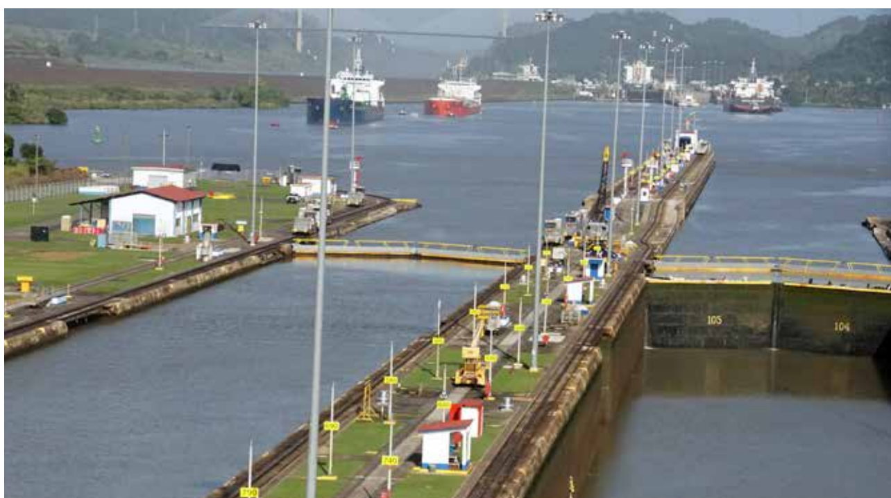
Canal de Panama