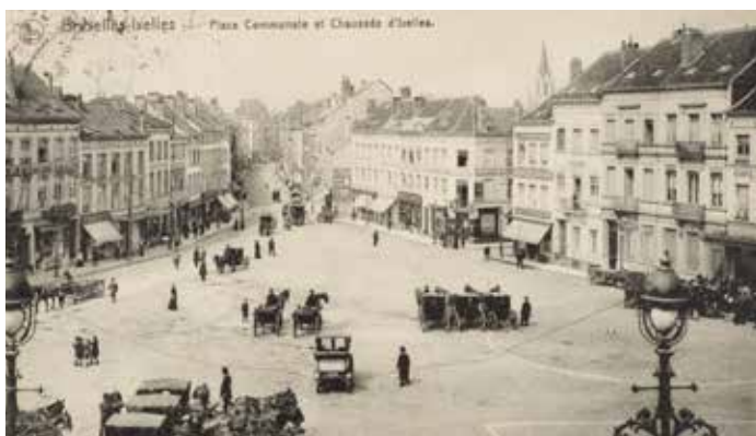
F. Cocqplein eind 19 de (eeuw)

Als eerste inrichting van de openbare ruimte door de gemeentelijke autoriteiten, was het Fernand Cocqplein ook het eerste openbare plein dat in Elsene werd aangelegd (halverwege de 19 de eeuw). Het groeide meteen uit tot een symbolisch centrum van de gemeente, een plek voor gezellig samenkomen en voor feestelijkheden. Het plein moest beantwoorden aan vele verwachtingen en verschillende beloftes inlossen, die zowel functioneel als symbolisch waren. Zo deed het plein niet alleen dienst als marktplaats, maar ook als "voorplein", dat onlosmakelijk verbonden was met het gemeentehuis en het perspectief ervan versterkte. Het is ook een kruispunt van verschillende verkeerswegen en een standplaats voor huurkoetsen.