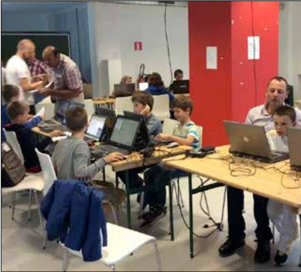
Jongeren leren spelenderwijs programmeren tijdens Coderdojo