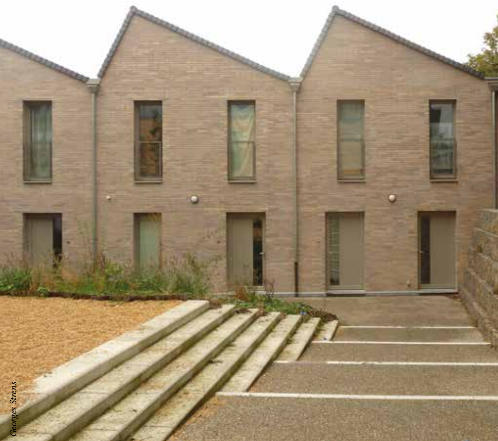
Rue de la Brasserie

Enfin, les espaces verts communaux sont entretenus selon le principe de gestion différenciée et sans une once de pesticides depuis déjà 3 ans. Ce principe tient compte de chaque type d'espace afin de lui appliquer un traitement adapté. Dans certains quartiers, on a laissé l'herbe remplacer la dolomie. Presque partout, on applique la tonte tardive qui permet de préserver la faune et la flore et d'accroître la biodiversité. Si, au départ, ces nouvelles pratiques ont pu susciter des réticences chez certains Ixellois, elles ont bien vite cédé au plaisir de voir davantage de verdure et à la valeur ajoutée quotidienne de ce type de gestion.