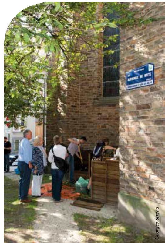
Compost, rue Alphonse Dewitte

Qu'elles soient, ou non, le fruit des contrats de quartier, les constructions et rénovations à Ixelles sont durables. Les nouveaux bâtiments sont à basse énergie ou "passifs". Les logements sociaux passifs de la rue de la Brasserie sont les premiers à avoir été réalisés à Ixelles et se sont distingués par de nombreux prix. Puits canadiens, chauffage solaire, récupération des eaux de pluie, robinets qui limitent la consommation grâce à de l'air pulsé, matériaux construction et