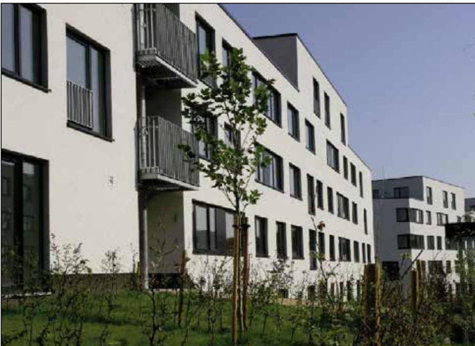
Le site "Akarova"