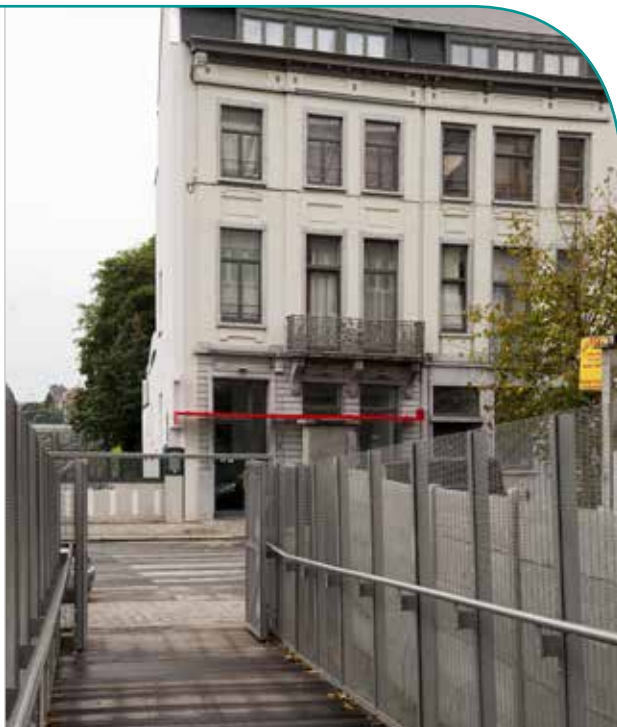
Le nouveau bâtiment d'Emergence-XL (13-49 rue du Sceptre) borde la passerelle de la voie ferrée.

Het nieuwe gebouw van Emergence-XL (Scepterstraat 13-49) naast de loopbrug over de spoorweg.