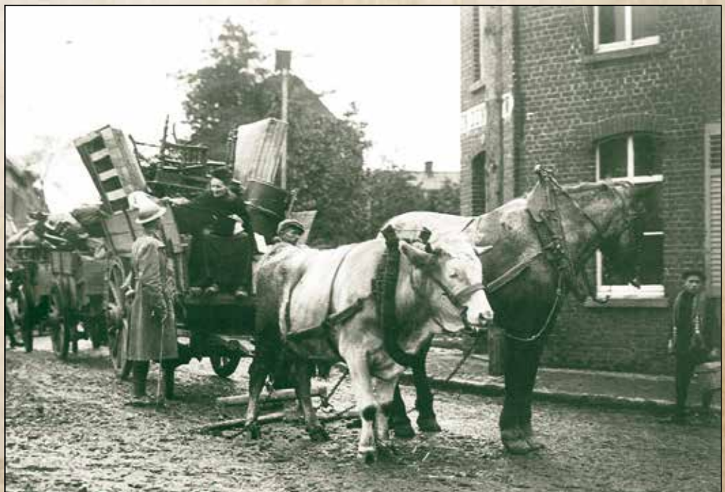
Cette photo de l'exode illustre également la pénurie de chevaux durant le premier conflit mondial, les équidés ayant été réquisitionnés pour le front. Deze foto van de uittocht toont het gebrek aan paarden tijdens WO1 aangezien ze in beslag genomen werden.

Je ne veux pas qu'ils te tuent - Ixelles et la Première guerre mondiale , disponible au service de l'Information, 227A chaussée d'Ixelles. 02 650 05 80.