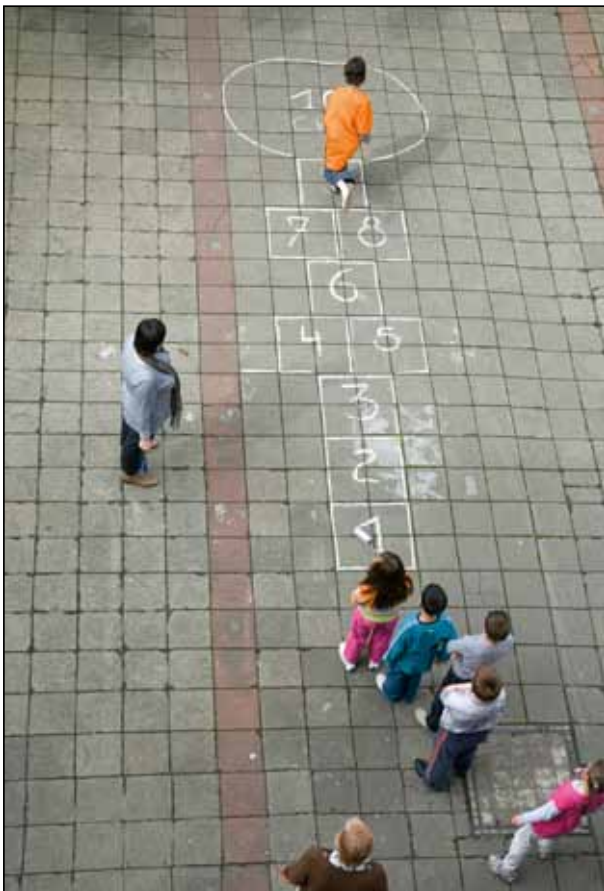
L'école des Mouettes

Grâce à son enseignement sur mesure, ils bénéficient de pédagogies adaptées à leurs besoins. Loin de leur fermer les portes, cette école les ouvre toutes grandes sur les établissements «ordinaires» n° 2, 5 et 9 où les élèves sont intégrés individuellement ou en petits groupes (max 6) au sein de classes ordinaires. L'assistance d'un deuxième enseignant facilite cette intégration et le bénéfice de cet encadrement rejaille sur toute la classe.