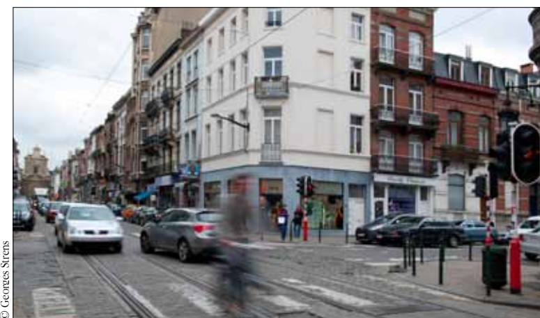
Rue du Bailli