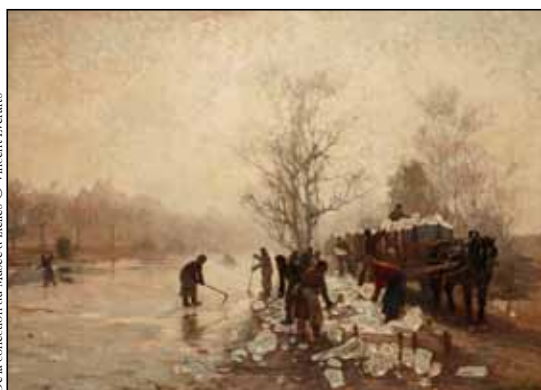
De la collection du Musée d'Ixelles © Vincent Everaerts

Source: Mémoire d'Ixelles , périodique trimestriel n°33 - mars 1989, par Emile Delaby